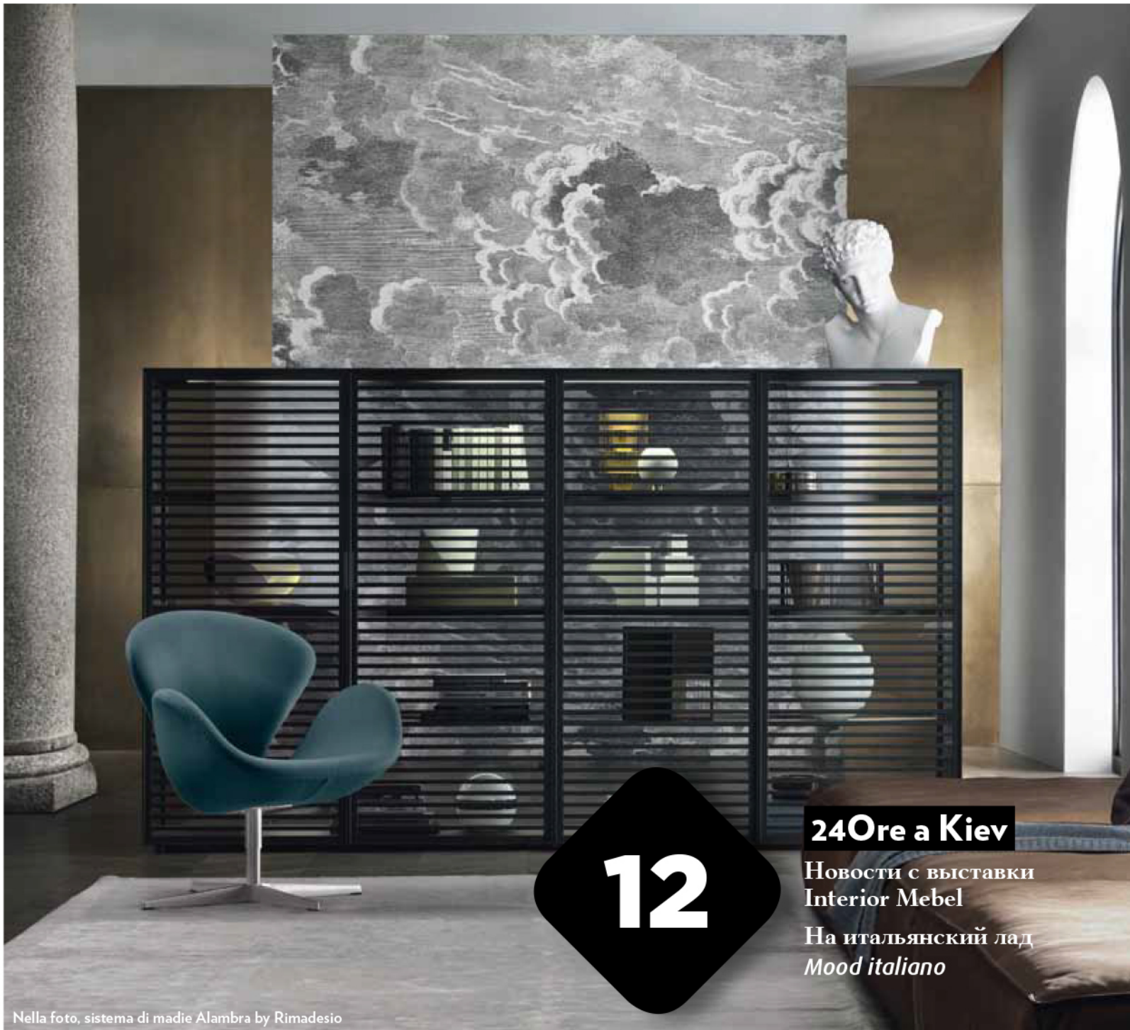
Nella foto, sistema di madie Alambra by Rimadesio

Year IX/Number 2 • Feb./Mar. 2015 • www.ifdm.it